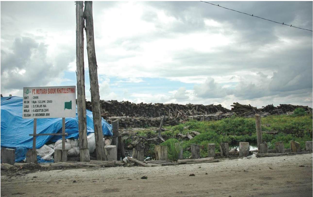
Pemasok kayu pulp PT Mutiara Sabuk Khatulistiwa

memberikan ruang untuk melaporkan pemilik manfaat dengan cara tersebut, meskipun, tentu saja regulasi ini tidak bertujuan demikian. 23 Merespon temuan di ringkasan kebijakan ini, grup induk korporasi APRIL, yaitu RGE, merespon bahwa grup perusahaannya mematuhi seluruh aturan perundang-undangan yang berlaku di Indonesia (lihat Lampiran D).