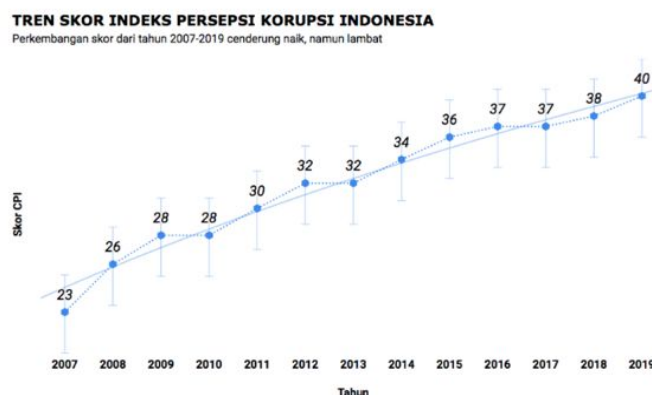
Grafik 1. Tren Skor Indeks Persepsi Korupsi Indonesia 2007-2019

Di saat KPK membutuhkan lima Pimpinan yang benar-benar berintegritas serta profesional, Presiden dan DPR malah meloloskan figur-figur dengan rekam jejak bermasalah. Selain itu kebutuhan legislasi yang memperkuat KPK seperti revisi Undang-Undang Pemberantasan Tindak Pidana Korupsi dan Rancangan Undang-Undang Perampasan Aset tidak kunjung diakomodir, yang dilakukan malah memberangus lembaga anti rasuah itu melalui revisi UU KPK.